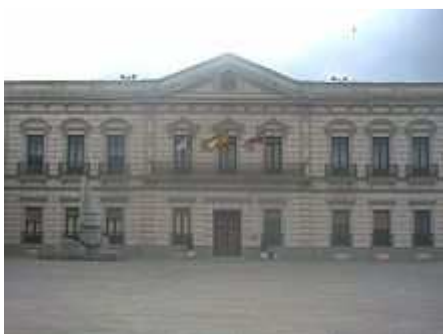
Ayuntamiento. Antiguo Casino