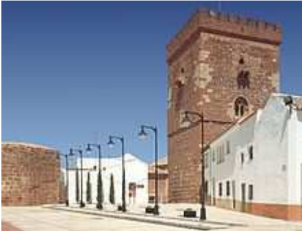
Torreón del Gran Prior