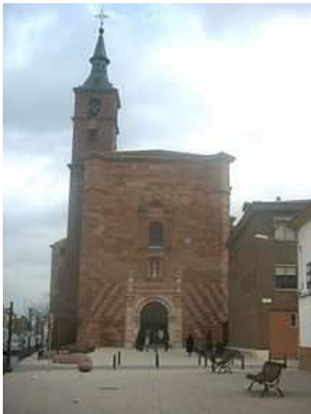
Iglesia de San Francisco