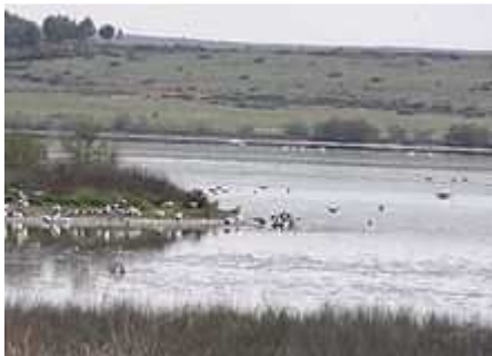
Complejo Lagunar de Alcázar