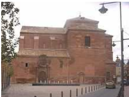
Iglesia de Santa Quiteria