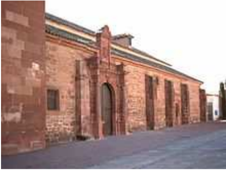
Iglesia Parroquial de Santa María