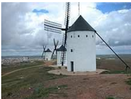
Molinos de viento