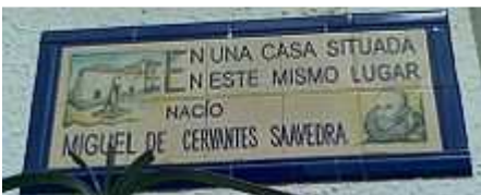
Cartel de la casa de Cervantes