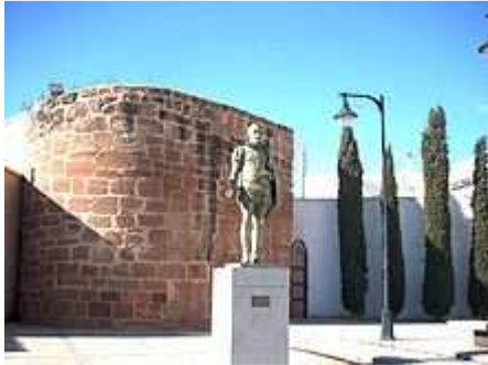
Estatua de Cervantes