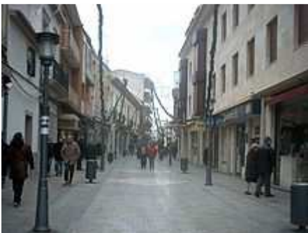
Calle Emilio Castelar