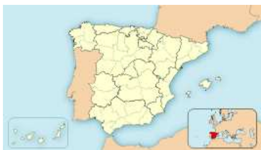
Alcázar de San Juan

Ubicación de Alcázar de San Juan en España.