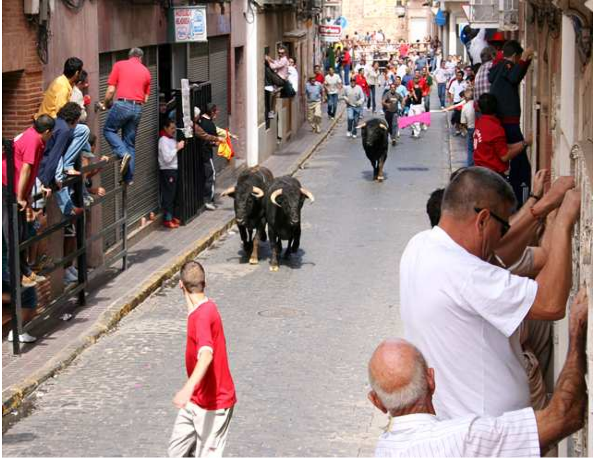
FIESTAS PATRONALES - SEPTIEMBRE