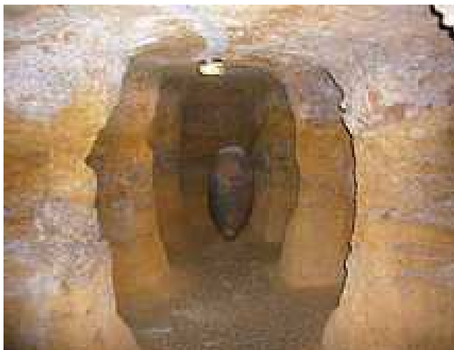
Cueva de Medrano donde estuvo preso Miguel de Cervantes .

En el año 1863 fue adquirida esta casa por el infante don Sebastián Gabriel de Borbón, prior de la orden de San Juan, con el fin de desarrollar en ella actos culturales y otras actividades. Entre otras cosas, invitó al editor Manuel Rivadeneira para que trasladase allí su imprenta, y allí hizo una edición del Quijote, en el año 1863. Esta edición tuvo un prólogo del dramaturgo español Hartzenbusch quien además da noticia de la casa en cuestión y dice que: maltratado y ruinoso el corredor que da vueltas al patio, lo demás de la fábrica subsiste duradero.