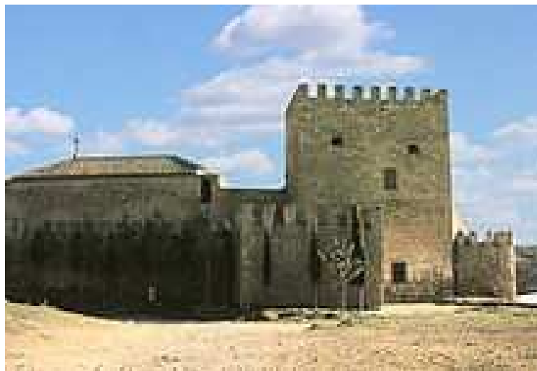
Castillo de Peñarroya.