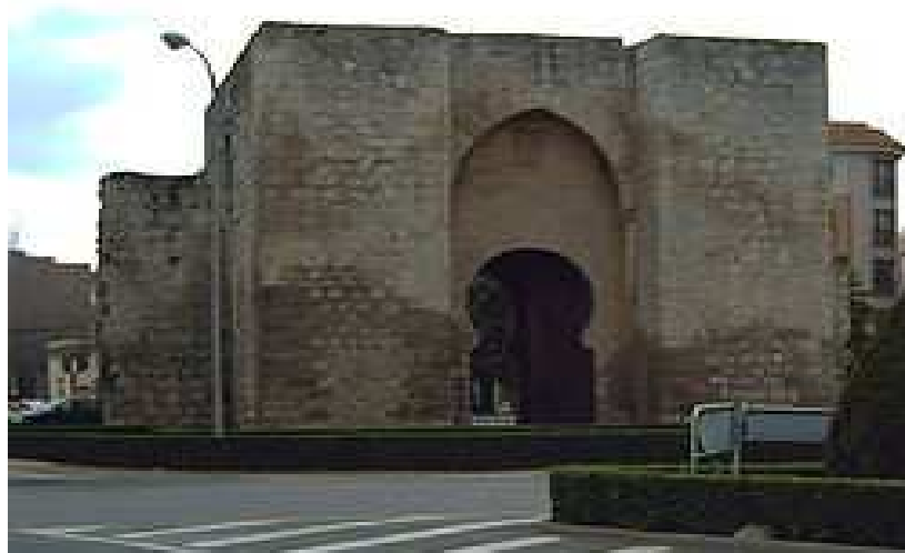
Puerta de Toledo.