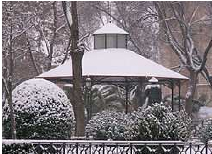
Jardines del Prado nevados. Enero de 2006 .