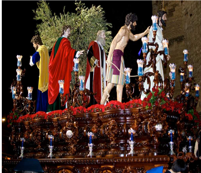
Misterio del Prendimiento, en el Saludo al Nazareno