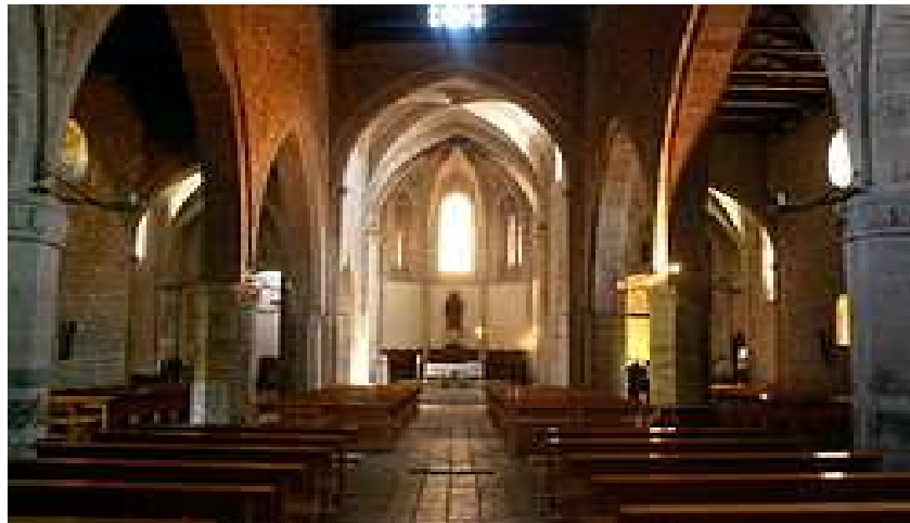
Interior de la Iglesia de Santiago.