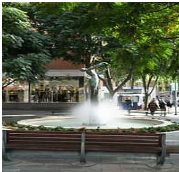
Homenaje al emplazamiento del "Pozo de Don Gil" alrededor del cual surgió la ciudad, obra del escultor López-Arza.

Inicialmente, en la actual ubicación de la ciudad, se encontraba un pequeño pueblo denominado Pozo (o Pozuelo) Seco de Don Gil. Este pueblo fue fundado mediante campañas de repoblación de las "tierras de nadie" que se efectuaron en la reconquista, y vio multiplicada su población tras el declive de la vecina Alarcos, en 1195. En el lugar donde se encontraba el pozo al que hace referencia el nombre de la antigua aldea, hoy existe una placa conmemorativa. Está en la Plaza del Pilar. El poder de las Órdenes Militares era entonces equiparable al de los reyes. El Maestre de cada orden actuaba como Señor Feudal, y tenía derecho a recaudar impuestos en las tierras de su dominio. En esto no sería una excepción la principal Orden en la zona, y la que ostentaba mayor poder: la Orden de Calatrava . Además su poder era tal, que podía ser una gran aliada (para proteger los límites del reino con Al-Andalus) o convertirse en un gran problema. En el año 1255, el Rey Alfonso X el Sabio renombra el municipio del Pozo Seco de Don Gil, fundando Villa Real. Colocaba así el rey una villa de su propiedad, con fieles funcionarios reales, en los dominios de la Orden de Calatrava.