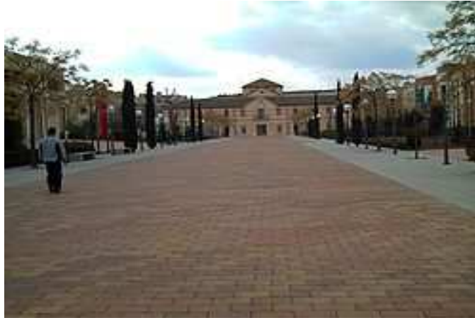
Rectorado de la Universidad de Castilla la Mancha en Ciudad Real.