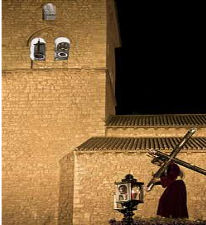
Iglesia de Santiago y el Cristo de las Penas en procesión el Martes Santo