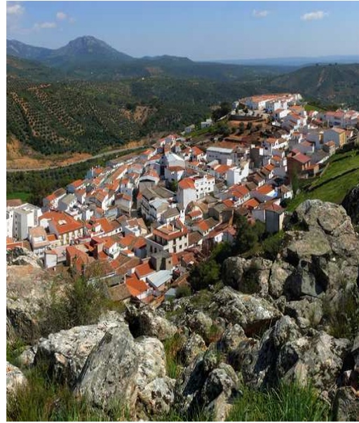
Ladera del pueblo