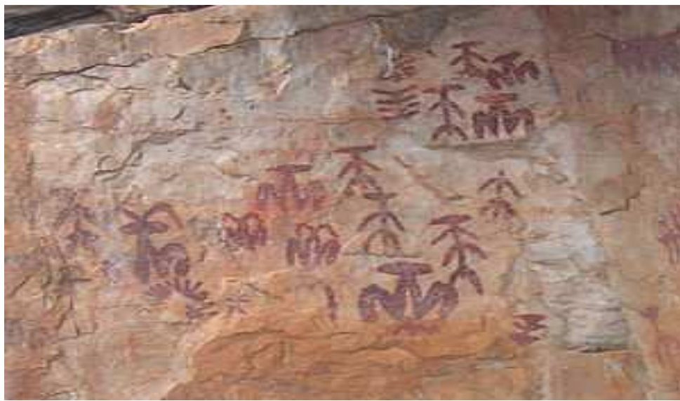
Pintura rupestre esquemática en Peña Escrita.

Pinturas rupestres en abrigos rocosos de los alrededores como Peña Escrita y La Batanera entre otras.