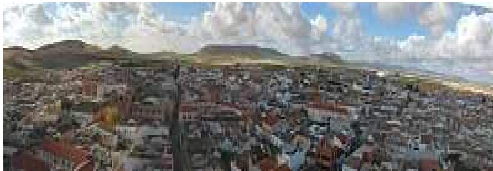
panorámica de Herencia.

Entre las fiestas más destacadas de Herencia se encuentra el Carnaval , declarado de Interés Turístico Regional.