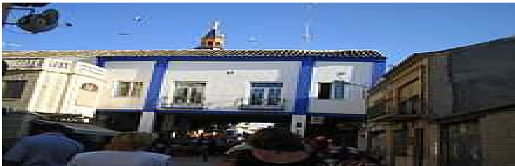
Entrada a la Plaza Mayor.