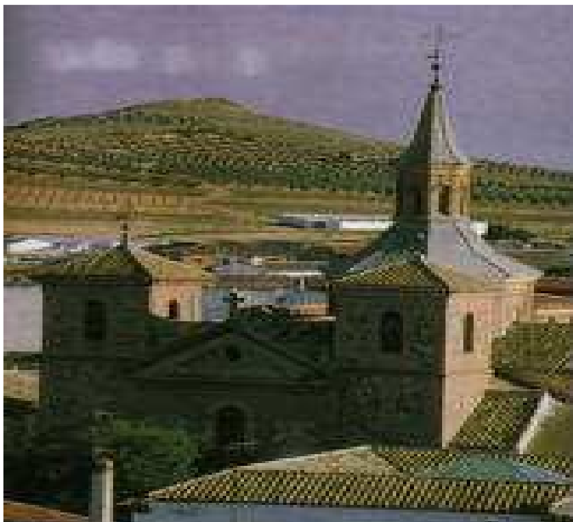
Convento de Herencia.