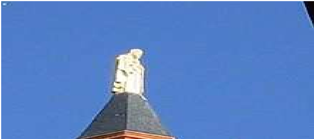
Cristo en lo alto de la iglesia