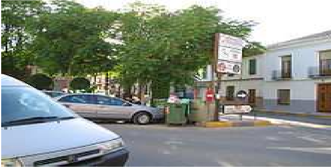
Plaza en el centro.