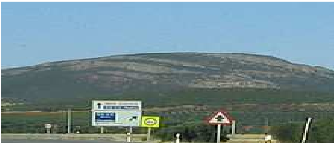
Torcón (928 m.).