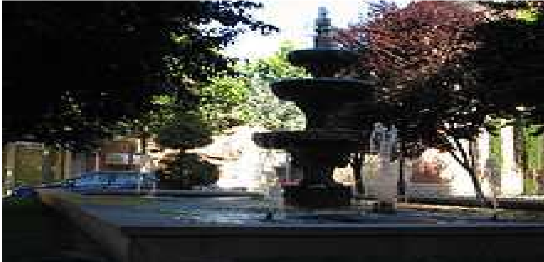
Fuente en la Plaza Mayor.