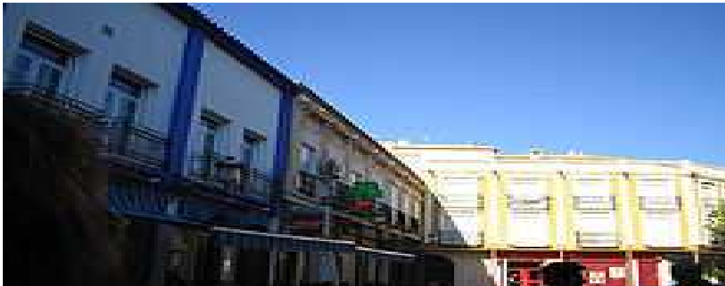
Plaza Mayor de Herencia.