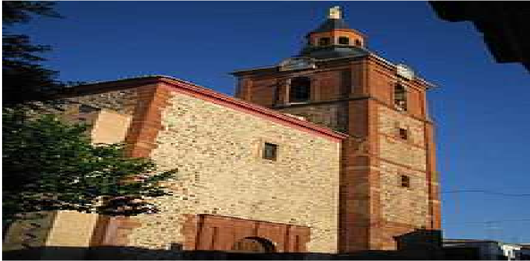
Iglesia de Herencia.