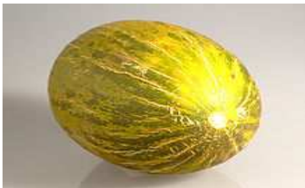
Melón de La Mancha .

Membrilla ha basado tradicionalmente su economía en la agricultura , sobre todo en la vid , el olivo , los cereales , como sus demás vecinos, y el cultivo del melón que cada año adquiere más importancia.