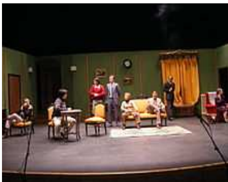
Festival de Teatro de Moral de Calatrava.