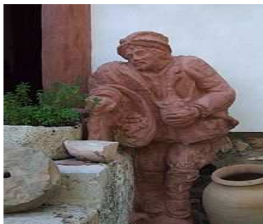
Escultura de Sancho Panza a las puertas de la "Casa museo ruta Cervantina".