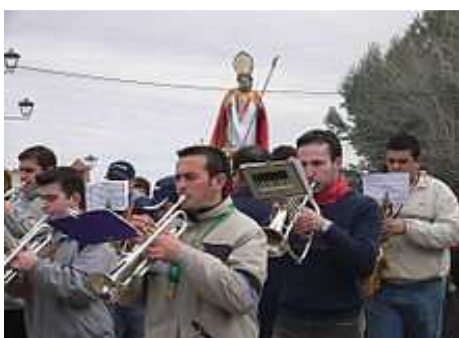
Procesión de San Blas.

El primer fin de semana de febrero , es la “ Romería de San Blas ” a quien se le encomienda la protección de la garganta. Se celebra en la ermita del mismo nombre situada a unos tres kilómetros de la localidad en dirección a Santa Cruz de Mudela al día siguiente es Resamblas , situado en el paraje del mismo nombre a unos dos kilómetros de la localidad en dirección a Manzanares , donde se concentra el mayor número de moraleños/as y visitantes.