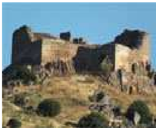
Castillo de Miraflores

Castillo de Miraflores y Puente de los moros : la construcción de este castillo no está muy justificada o al menos sus orígenes y motivaciones se desconocen aunque la teoría más factible sería la de la defensa de Piedrabuena durante el sitio de la localidad durante la reconquista . El castillo se encuentra sobre una colina a 2 km del núcleo urbano. Su estilo, pese a su alto estado de ruinas parece ser el típico de la época de la reconquista cristiana del siglo XII. A pesar de su importancia histórica, este monumento está incluido dentro de la Lista Roja de Patrimonio en peligro de desaparición o destrucción de la asociación Hispania Nostra . El Puente de los moros, sito muy cercano a él y de similares características y antigüedad parecen indicar que se construyó junto al Castillo de Miraflores. Su origen no era el de puente sino el de muro de contención que embalsaba las aguas del arroyo de La Peralosa facilitando la tarea de los residentes en el castillo de recoger las mismas.