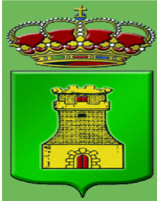
Escudo de Piedrabuena usado por el Ayuntamiento