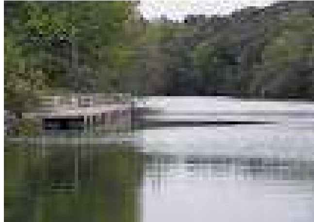
Río Bullaque y Tabla de la Yedra

Rio Bullaque y Tabla de la Yedra: a 2,5 km del pueblo se encuentra el río Bullaque , afluente del Guadiana, uno de los pocos con caudal y aguas limpias en la provincia de Ciudad Real. Rodeado de lugares de alto valor ecológico y paisajístico, la flora de su rivera se caracteriza por nenúfares, álamos, chopos, sauces y fresnos y en lo que a fauna se refiere se pueden encontrar nutrias, martines pescadores, zorros, erizos, y en sus aguas distintas especies de peces y cangrejos.