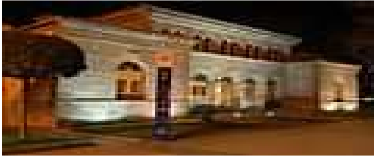
Fachada de los Baños.