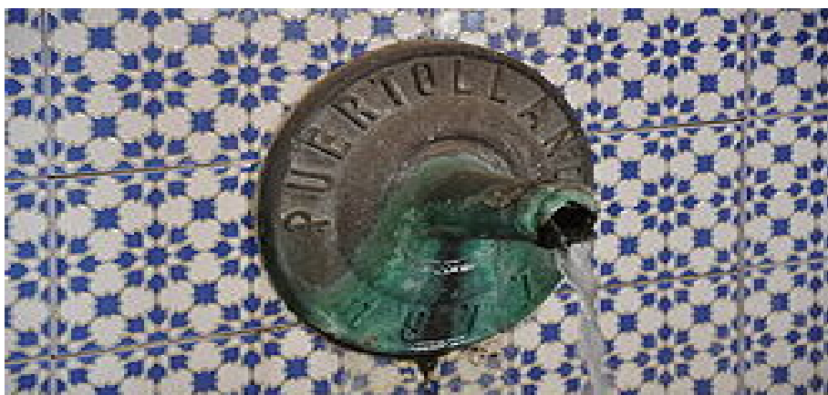
Fuente de los cinco caños o Fuente del Pilar.

Mediado el siglo XIX, el vecindario de Puertollano, se surtía de dos manantiales de agua dulce: la llamada Fuente de la Santa, emplazada en la falda del Cerro de Santa Ana, y de otro manantial ubicado al este de la localidad.