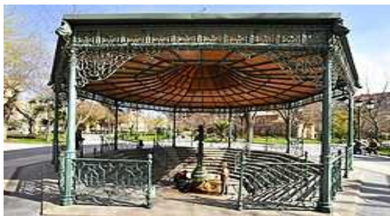
Fuente Agria en el Paseo San Gregorio.

Al no existir establecimientos públicos de residencia para los centenares de personas que cada año venían a Puertollano se recurría a casas particulares.