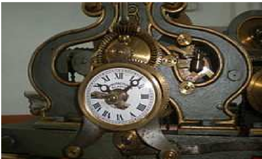
Maquinaria del reloj de flores. (Original S. XIX)

El primitivo reloj fue inaugurado en la feria de mayo de 1962. Poseía forma esférica y vino a ocupar el lugar que dejó un antiguo templete de música.