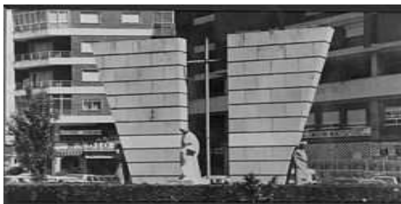
Monumento a los caídos en el trabajo.

Todo pueblo minero tiene que pagar lamentablemente un tributo en vidas humanas a las entrañas de la tierra.