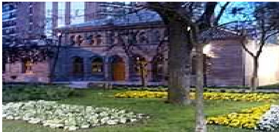
Oficina de Turismo y Atención al ciudadano

Fiestas de Septiembre en honor de su patrona, la Virgen de Gracia, cuya festividad se celebra el día 8 de septiembre. Con una multitudinaria procesión de fieles que acompañan a la Virgen durante su recorrido por las calles,