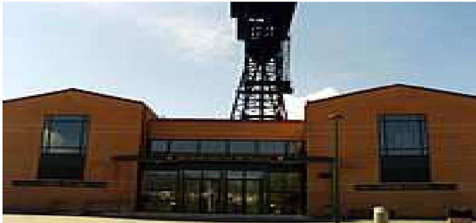
Museo de la Minería y Castillete Pozo Norte.