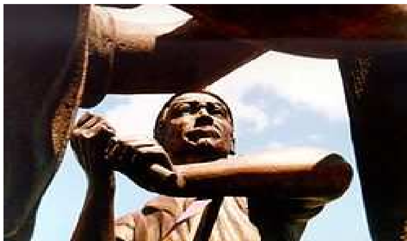
Monumento a la Minería.

El monumento se realizó con la idea de inmortalizar las raíces mineras de Puertollano. Fue ejecutado por el escultor José Noja y está situado junto al puente de San Agustín, que enlaza el centro urbano con las barriadas mineras de “El Carmen” y de “Las Mercedes”. Este monumento fue inaugurado el día 4 de mayo de 2000. El conjunto es una pieza única de bronce cuyas medidas son 2,7 x 4,5 x 2,3 metros. Representa a un grupo de mineros trabajando dentro de una galería, con un estilo realista intentando mostrar dos escenas en un mismo momento: la entibación y la extracción realizada por un picador.