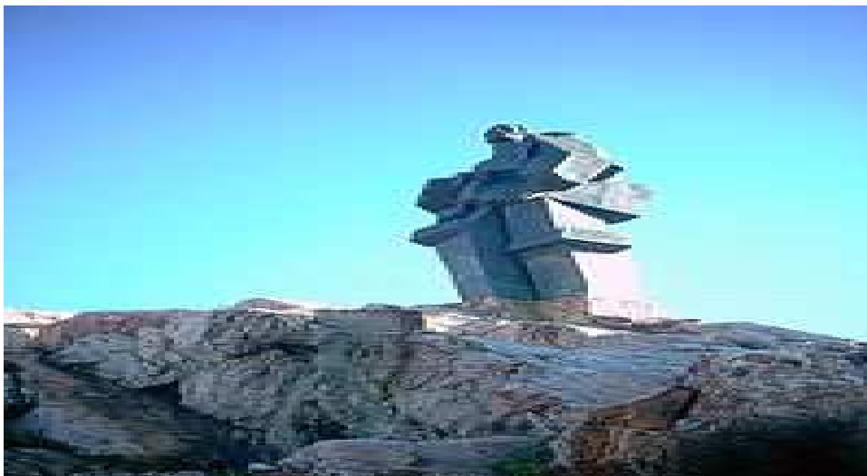
Monumento al minero, obra de José Noja .

Escultor José Noja Situado en el cerro de Santa Ana, el Monumento al Minero es obra del escultor José Noja, y se realizó con los fondos provenientes de una cuestación (gracias a la labor que desarrolló una Comisión popular que se constituyó) y la aportación del Ayuntamiento.