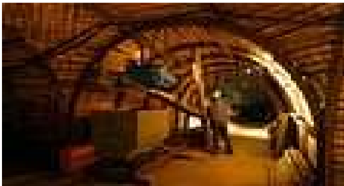
Mina imagen, Museo de la Minería de Puertollano.