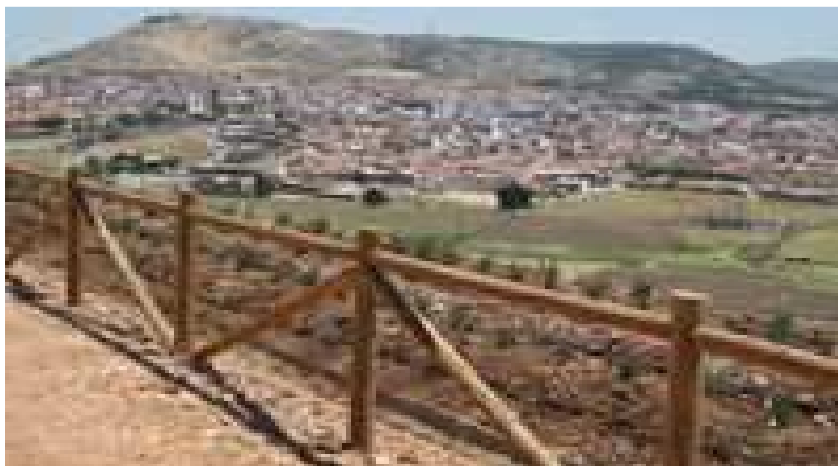
Vista panorámica desde el Parque del Terri.

Escombrera artificial elevada a partir de los años 20 del siglo XX con las cenizas y escorias de carbón procedentes del lavadero y destilería de carbones y pizarras bituminosas de Calatrava. Con una altura de 80 metros, dejó de utilizarse en los años 60, cuando la empresa Peñarroya cerró sus instalaciones. En 2008, el Ayuntamiento en su afán por conservar y poner en valor el patrimonio minero, planifica la transformación de este montículo en una zona verde para el recreo y ocio de la población. El parque del Terri se inaugura en junio de 2010. existen varias teorías sobre su denominación, posiblemente de origen francés (Terrier, Terril), aunque la única denominación por la que podría ser sustituida es por la de monte del Terri, el monte de los mineros, el monte de los esfuerzos. Junto a la Nacional 420 se ha ejecutado un área de entrada con una gran explanada de zahorra compactada como pavimento que sirve como aparcamiento a aquellos visitantes que pretendan acceder peatonalmente a la coronación de la montaña. En lo alto de la montaña se puede disfrutar de diversas vistas de Puertollano, desde la