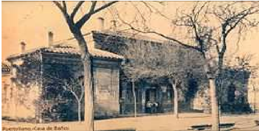
Antiguo Balneario de agua agria “Casa de Baños”.

Obra arquitectónica que data de 1850 realizada a base de sillares de arenisca extraída de una cantera local.