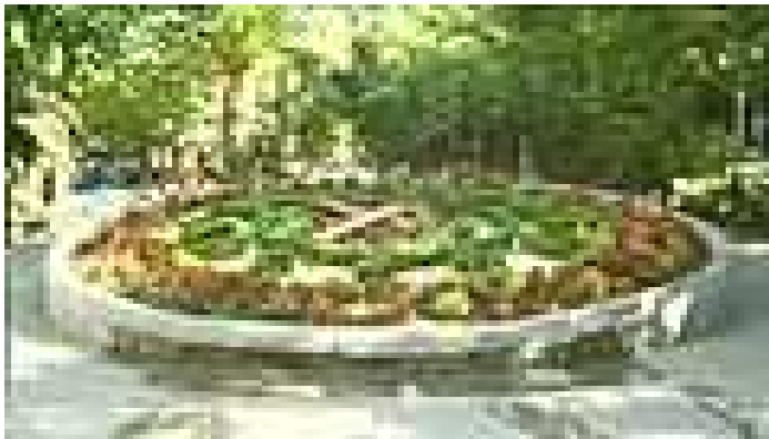
Reloj de Flores, Paseo San Gregorio.